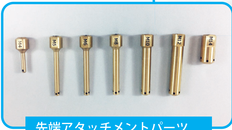
先端アタッチメントパーツ