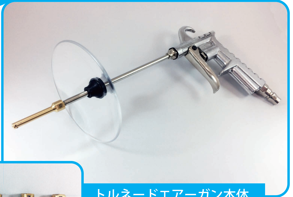
トルネードエアガン本体