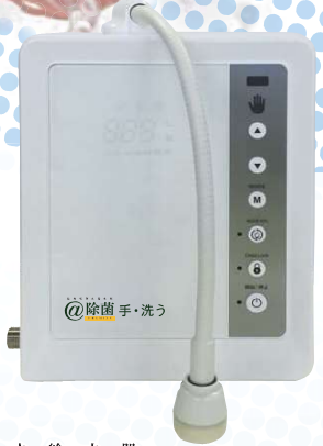
除菌電解水給水器