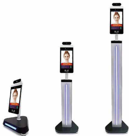
AJ-1081D2 AJ-1081D3 AJ-1081D4 ▲ 60cm ▲ 110cm スタンド重量:6.0kg スタンド重量:8.0kg