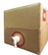
20ℓボックスタイプ 詰め替え用に最適です。