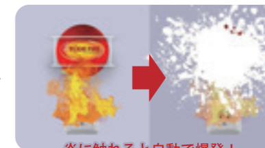
炎に触れると自動で爆発！

火災被害を抑えるために最も重要な初期消火を簡単にする消火具、エライドファイアボール。火に反応して消火剤を周囲に散布するため出火直後の初期消火活動に効果抜群です。火元に投げ込む、あるいは転がして使用し簡単消火。誰でも迷うことなく消火活動ができます。また、自動消火機能があることで、無人の場所・時間帯にもしっかりと消火できる優れたものです。